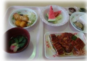
8月3日 納涼お食事会