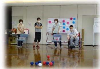
9月14日 ポッチャ大会