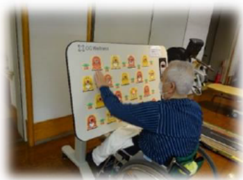
2月9日 お楽しみレクリエーション