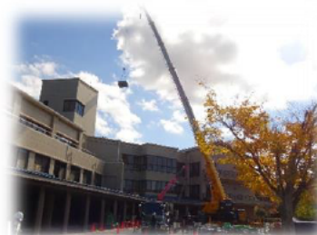
11月 屋根塗装工事資材搬入の様子