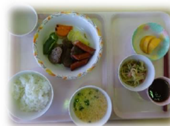
11月9日 バーベキュー大会