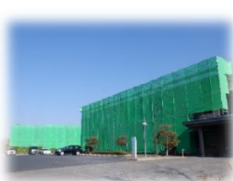
年末のケアプラザ呉（屋根塗装工事中）