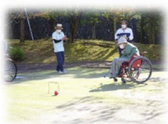
10月19日 ゲートボール大会