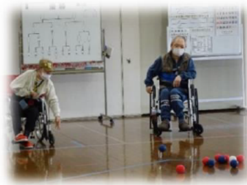
3月9日 ポッチャ大会