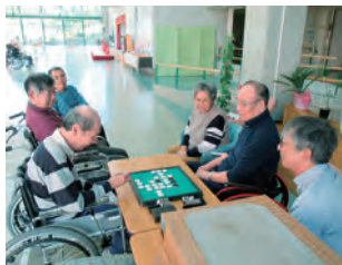
ゲームを楽しむ入居者の方々