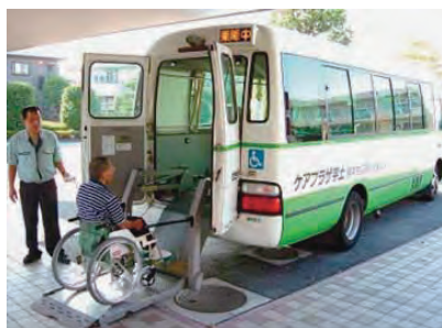
マイクロバスでの送迎

また、入居者の皆様が潤いのある快適な生活が送れるよう、お花見会や納涼祭、運動会や年忘れ会など四季折々に各種の行事を行っています。また、日用品や介護用品などを販売している売店もあります。