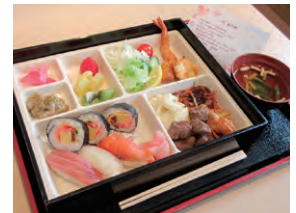
誕生日会での食事